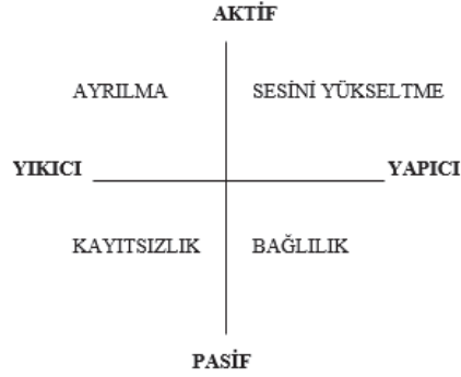
Şekil 2: İşteki Tatminsizliğe Karşı Gösterilen Tepkiler (Özkalp, Kirel, 2016: 120)

İş görenlerin işteki tatminsizliklerini ifade şekilleri yapıcı–yıkıcı ve aktif–pasif olmak üzere iki boyuttur.